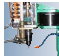
Colocación automática y semi-automática.