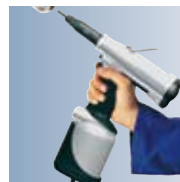
RIVKLE® P2005 para la colocación por recorrido de M3 a M12.