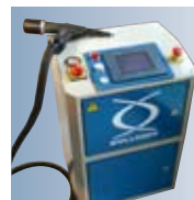
EPK Compact con control de la calidad de la colocación integrado.